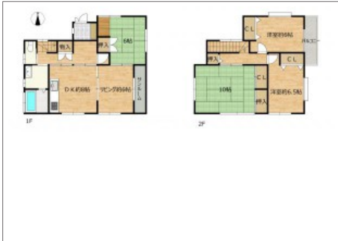
写真 内覧希望の方はお電話ください。