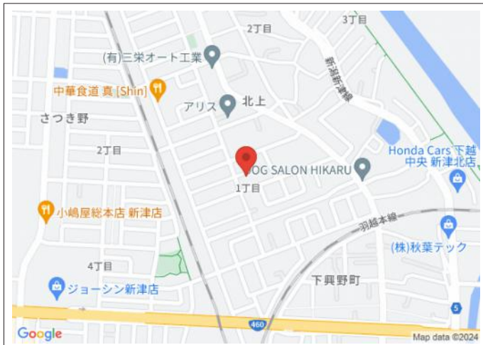
写真 内覧希望の方はお電話ください。