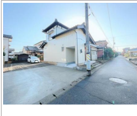
写真 【間取り】4LDKの広々とした住宅です。駐車場から使える物置ス