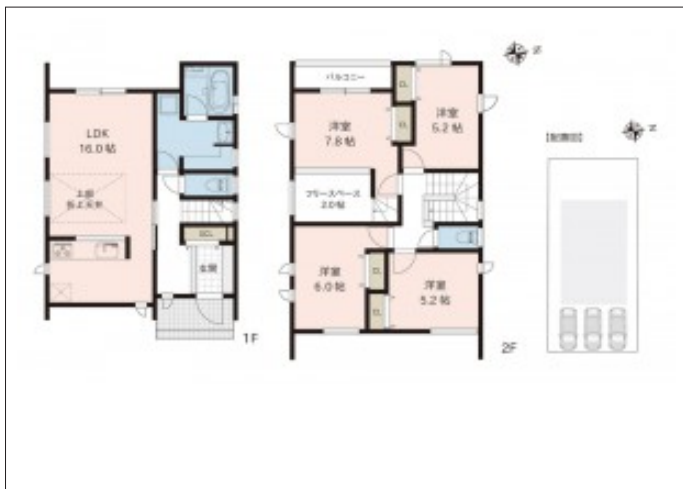
写真 内見ご希望の方はお電話ください。